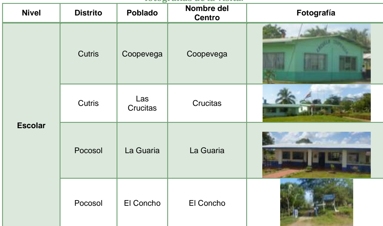
Tabla N°4: Principales centros educativos de la zona de influencia de la Trocha Fronteriza, para los distritos de Cutris y Pocosol, del cantón de San Carlos, con fotografías de la visita.

Asimismo, en algunos casos fue posible ubicar en sitio el centro educativo, por lo que en la tabla número 4, se presentan estos centros educativos con fotografía.